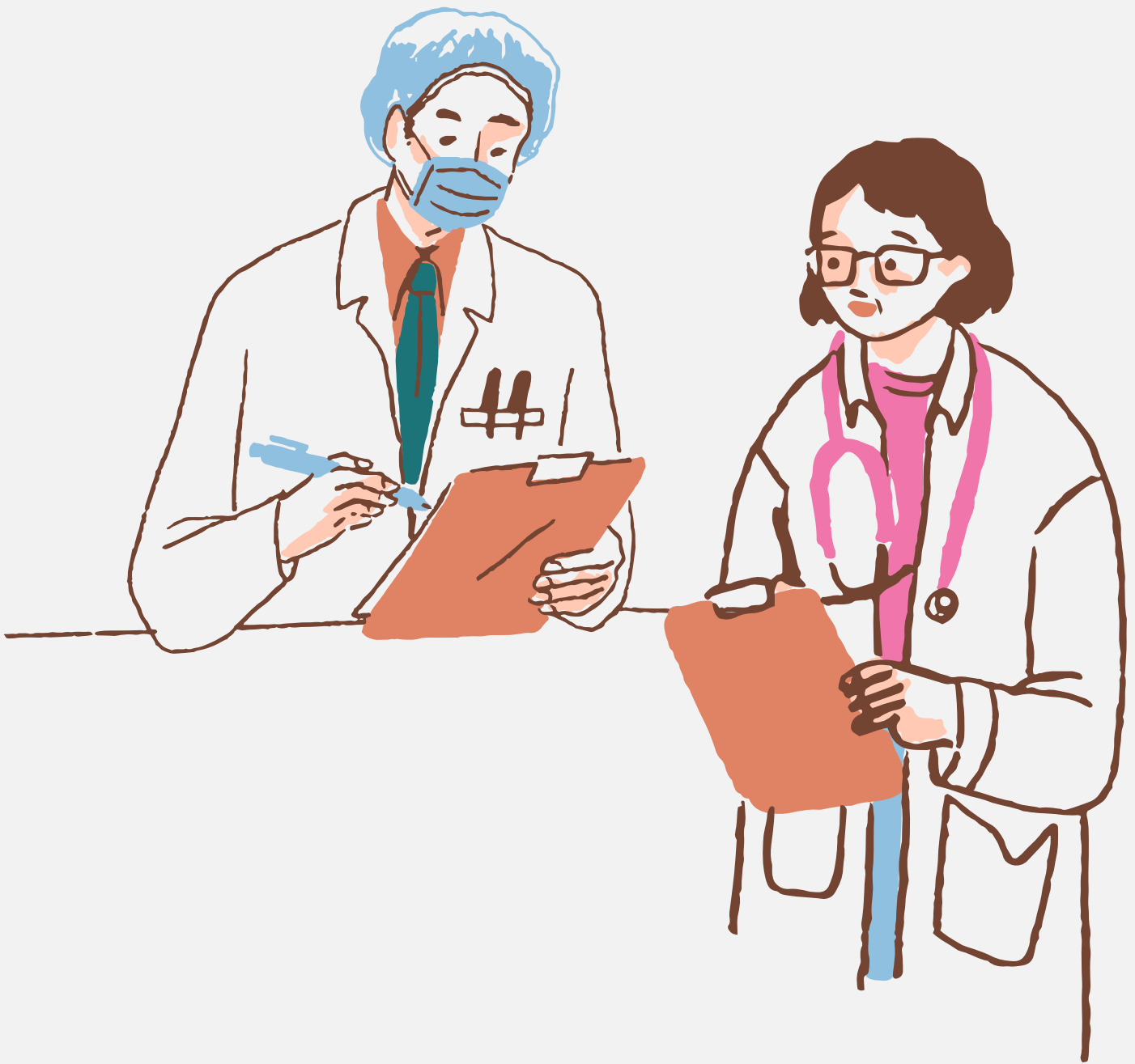
Nadšandardný hygienicko-epidemiologický režim.

Konziliárna spolupráca lekárov v prípade potreby.